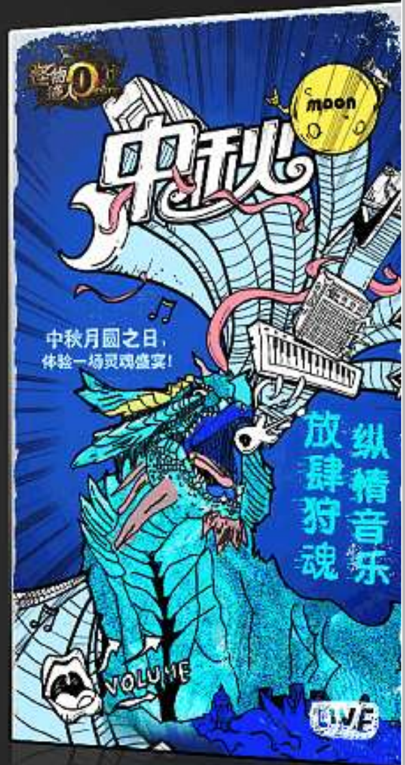
活动海报示例/抽象手绘风