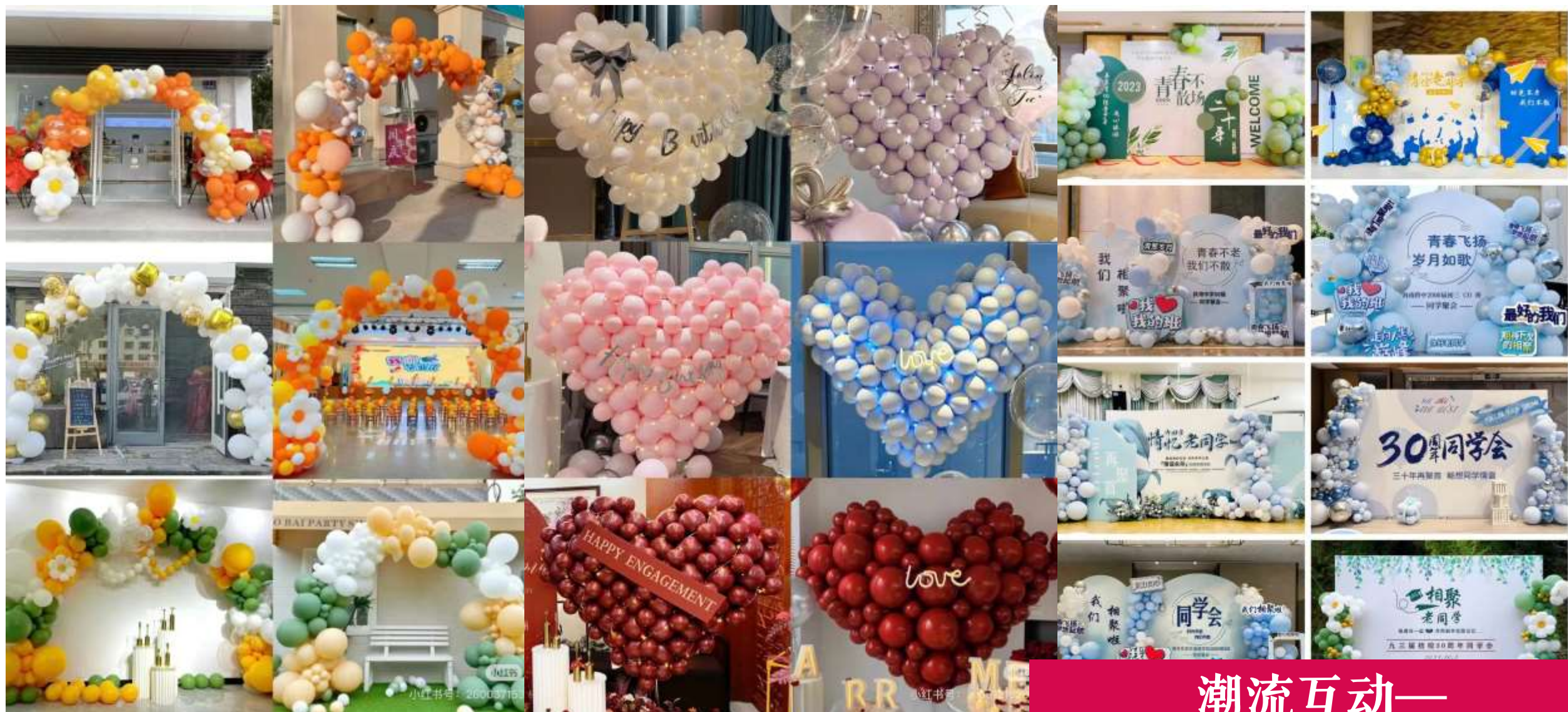
潮流互动— 气球氛围包装